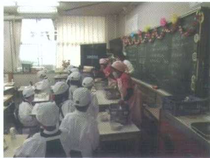
給食準備ボランティアにご協力くださったみなさま