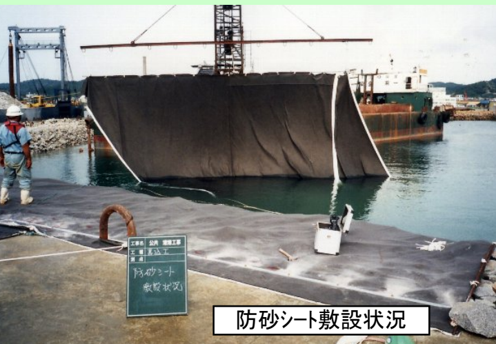
防砂シート敷設状況