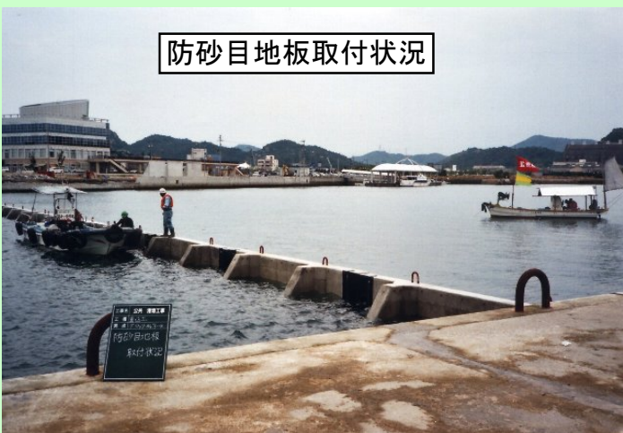
防砂目地板取付状況