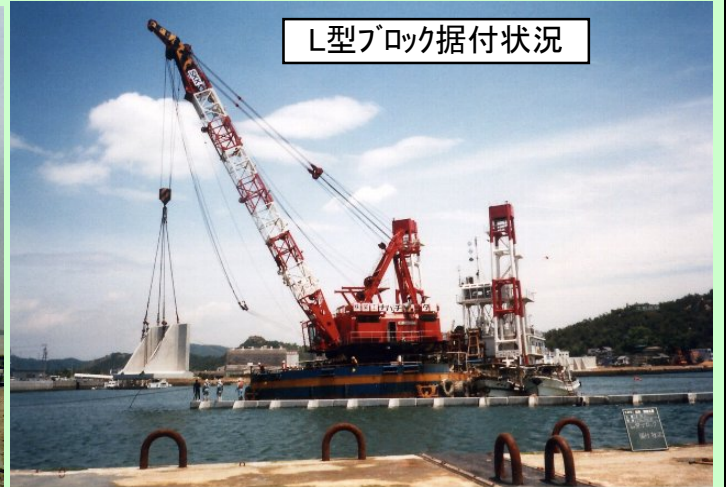
L型ブロック据付状況