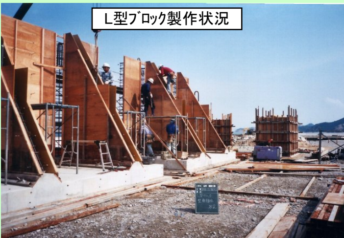
L型ブロック製作状況