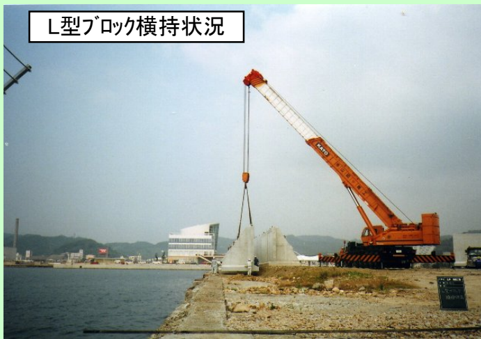
L型ブロック横持状況