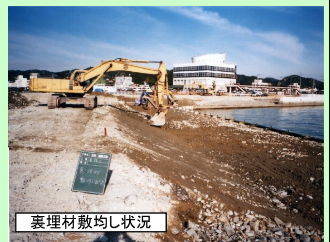
裏埋材敷均し状況